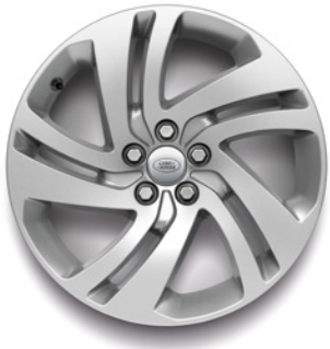
18" S 5 DVOJITÝMI PAPRSKY (STYLE 5074) SILVER Standardní výbava verze S