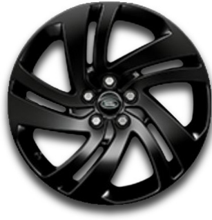
18" S 5 DVOJITÝMI PAPRSKY (STYLE 5074) GLOSS BLACK