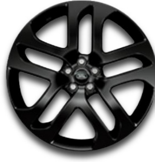
21" S 5 DVOJITÝMI PAPRSKY (STYLE 5078) 2 GLOSS BLACK