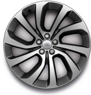
20" S 5 DVOJITÝMI PAPRSKY (STYLE 5089) GLOSS DARK GREY CONTRAST, DIAMOND TURNED