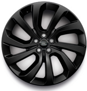
20" S 5 DVOJITÝMI PAPRSKY (STYLE 5089) GLOSS BLACK