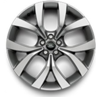
20" S 5 DVOJITÝMI PAPRSKY (STYLE 5076) 1 GLOSS MID-SILVER CONTRAST DIAMOND TURNED Standardní výbava verze Dynamic HSE