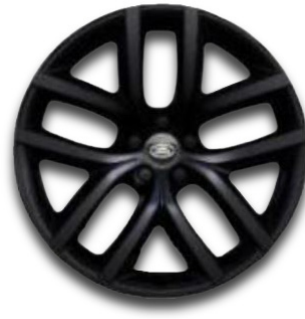
19" S 5 DVOJITÝMI PAPRSKY (STYLE 5136) GLOSS BLACK