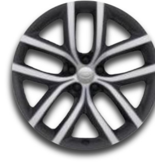
19" S 5 DVOJITÝMI PAPRSKY (STYLE 5136) GLOSS DARK GREY CONTRAST, DIAMOND TURNED Standardní výbava verze Dynamic SE