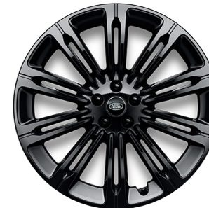
22" S 10 DVOJITÝMI PAPRSKY (STYLE 1075) 6, 7 GLOSS BLACK