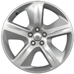
19" S 5 PAPRSKY (STYLE 5108) 1 GLOSS SPARKLE SILVER Standardní výbava verze S