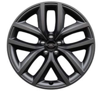
20" S 10 PAPRSKY (STYLE 1089) 2 SATIN DARK GREY Standardní výbava verze Dynamic SE