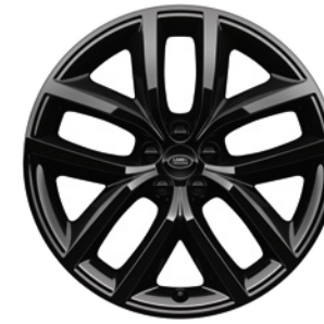
20" S 10 PAPRSKY (STYLE 1089) 4 GLOSS BLACK