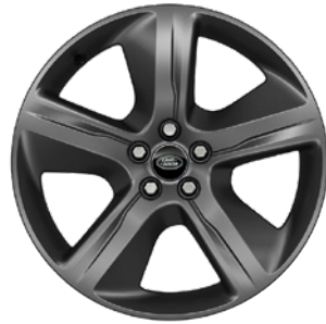
19" S 5 PAPRSKY (STYLE 5108) 2 SATIN DARK GREY