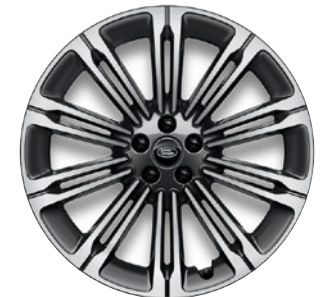
22" S 10 DVOJITÝMI PAPRSKY (STYLE 1075) 6, 7 GLOSS DARK GREY CONTRAST, DIAMOND TURNED Standardní výbava verze Autobiography