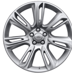
20" SE 7 DVOJITÝMI PAPRSKY (STYLE 7014) 3 GLOSS SPARKLE SILVER