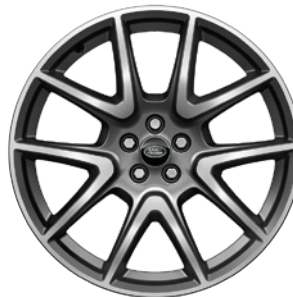
21" S 5 DVOJITÝMI PAPRSKY (STYLE 5109) 6 SATIN DARK GREY CONTRAST, DIAMOND TURNED