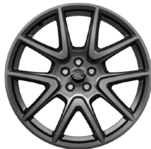
21" S 5 DVOJITÝMI PAPRSKY (STYLE 5047) 5, 6 GLOSS BLACK